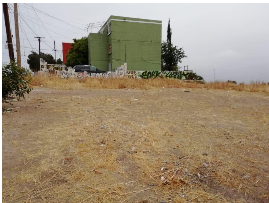
Cuadro 3. Características de las viviendas particulares habitadas alrededor del centro comunitario